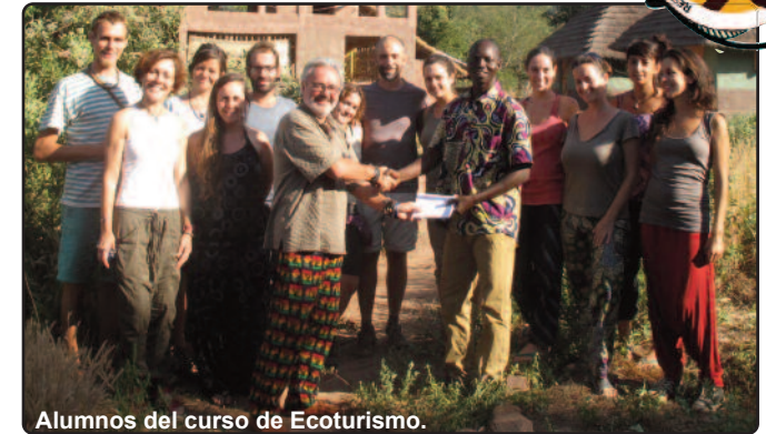
Alumnos del curso de Ecoturismo.

Para este verano ya está abierta la oferta formativa con